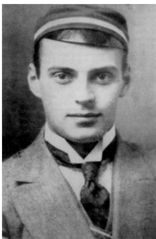
Na studiach w Rydze w 1914 r.