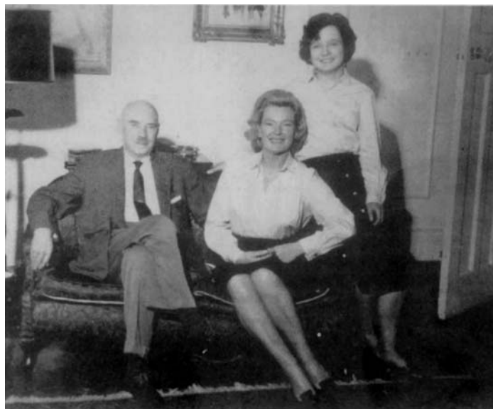
Z żoną i córką.

W latach 1946–1954 był Naczelnym Wodzem i Generalnym Inspektorem Polskich Sił Zbrojnych. W maju 1954 r. został mianowany generałem broni.