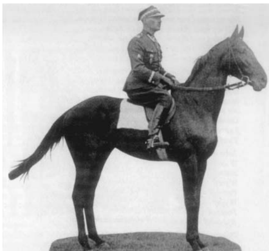
W 15. Pułku Ułanów Poznańskich.

Na wieść o formującym się wojsku polskim – Korpusie Polskim gen. Dowbora-Muśnickiego wstąpił do niego nie zwlekając. Brał czynny udział w formowaniu 1. Pułku Ułanów (późniejszy 1. Pułk Ułanów Krechowieckich), w którym dowodził szwadronem. Następnie został szefem sztabu 1. dywizji strzelców. Po rozwiązaniu Korpu-