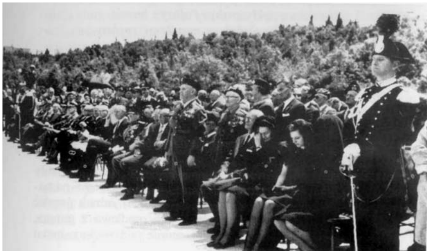
Uroczystości pogrzebowe na Monte Cassino.

tej nieosądzonej winy. Ponad 60-letnia już historia sprawy katyńskiej nie doczekała się jak dotąd swego epilogu.