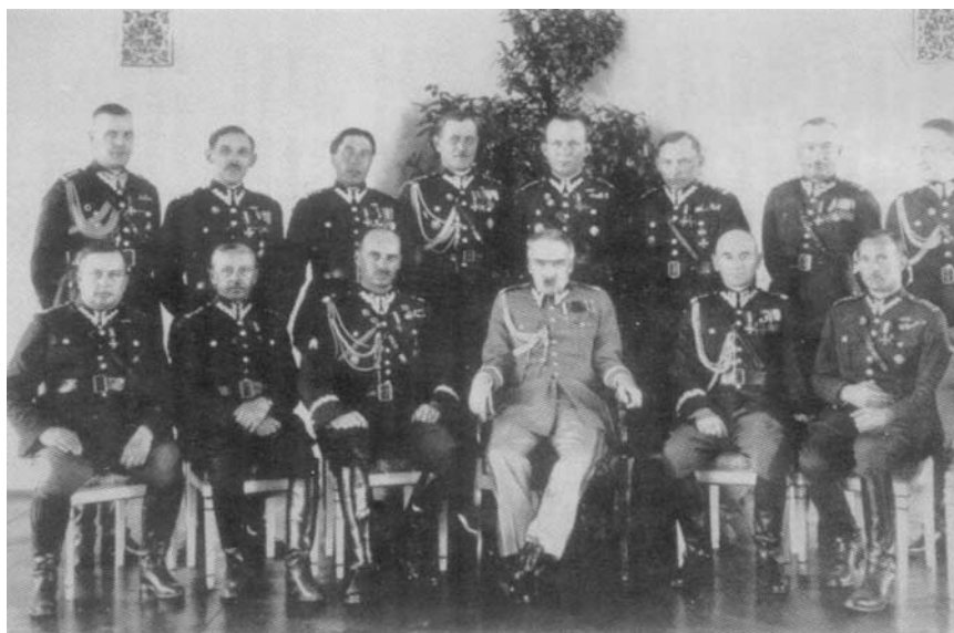
Po grze wojennej w Wilnie w 1934 r., wyróżniony miejscem po prawej stronie Marszałka Piłsudskiego. Pierwsze zdjęcie Andersa po awansie na generała.

również umiał wychować młode pokolenie kawalerzystów, przekazując im swoje doświadczenia, rozbudzając w nich zamiłowanie dla sportu jeździeckiego.