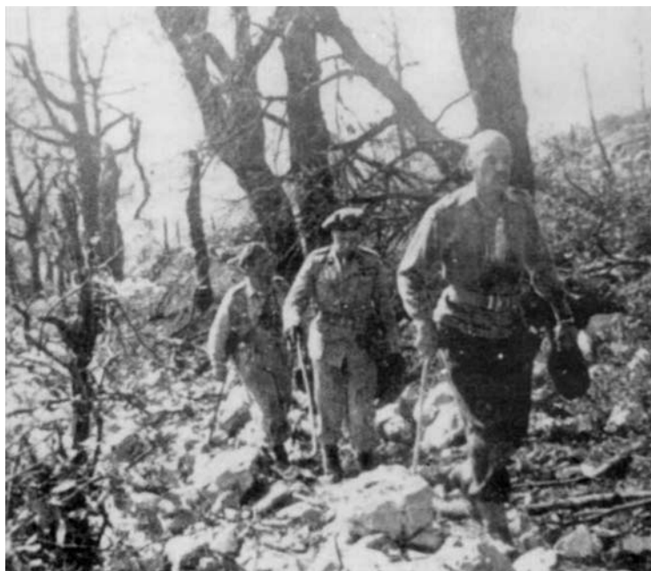
Na stokach Monte Cassino w czasie bitwy.

było odkarmione, dość dobrze wyszkolone, dyscyplina stała na wysokim poziomie, ponadto żołnierz pragnął walki. Czuł instynktownie, że oczy Polaków na świecie, a przede wszystkim w męczonym Kraju są na niego zwrócone.