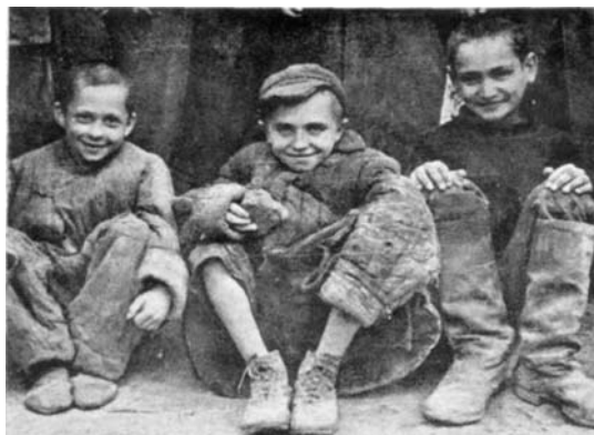
Rosja: październik 1941 r.