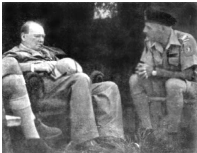
Premier Churchill u gen. Andersa na froncie włoskim pod Fano.

Niestety, bohaterstwo polskich żołnierzy nie przyniosło efektu, o jakim marzył dowódca II Korpusu. Postanowienia jałtańskie z lutego 1945 r. przekreśliły nadzieje na wolną i suwerenną Polskę. Zaledwie dzień po ogłoszeniu decyzji tzw. Wielkiej Trójki generał Anders zareagował bardzo ostro i stanowczo. W telegramie wysłanym do prezydenta Władysława Raczkiewicza zadepeszcował: Wobec tragicznego komunikatu ostatniej konferencji trzech w Jałcie, melduję, że II Korpus nie może uznać jednostronnej decyzji, oddającej Polskę i Naród na łup bolszewikom. Zwróciłem się do władz sojusznicznych o wycofanie oddziałów Korpusu z odcinków bojowych. Nie mam sumienia żądać w obecnej chwili od żołnierza ofiary krwi.