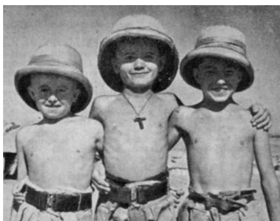
Palestyna: październik 1942 r.

Generał Anders nie miał złudzeń co do stosunku Sowietów do Polaków. Zbyt dobrze poznał Rosję i system w niej panujący. Pozornie ugodowe stanowisko Sowietów wynikało z dotychczas niepomysłnego przebiegu wojny z Niemcami, a nie ich dobrej woli. Dlatego generała nie opuszczała myśl o jak najszybszym wyprowadzeniu Polaków z „domu niewoli” do kontrolowanej przez Brytyjczyków Persji (Iranu). Wyjście to wydawało się jedynym właściwym rozwiązaniem. Okazja ku ewakuacji z Rosji nadarzyła się w marcu 1942 r., gdy władze sowieckie drastycznie ograniczyły racje żywnościowe, motywując to opóźnieniem amerykańskich dostaw zboża. Generał Anders na-