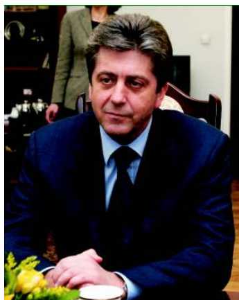
Prezydent Republiki Bułgarii Georgi Pyrwanow