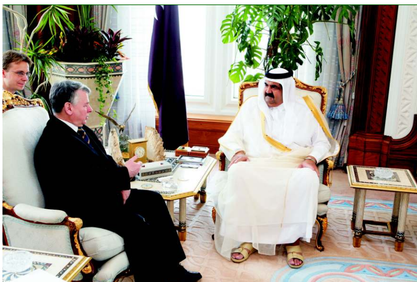
Rozmowa z emirem Kataru, szejkiem Hamadem Bin Khalifem Al-Thani

Marszałek B. Borusewicz przekazał emirowi zaproszenie, wystosowane przez prezydenta Lecha Kaczyńskiego, do złożenia wizyty w Polsce. Zaproszenie zostało przyjęte z zadowoleniem.