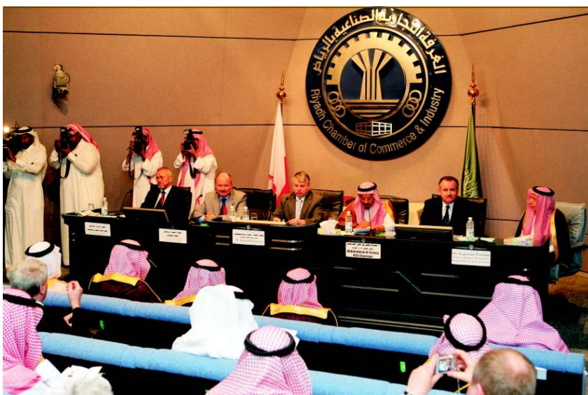
Spotkanie z przedsiębiorcami saudyjskimi

Tego samego dnia marszałek Senatu spotkał się z szejkiem Salehem Bin Humaidem, przewodniczącym Zgromadzenia Doradczego Królestwa Arabii Saudyjskiej.