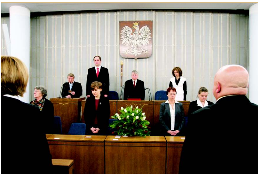
Posiedzenie Senatu rozpoczęło uczczeniem trzeciej rocznicy śmierci papieża Jana Pawła II

Na obrady Senatu przybyli premier Donald Tusk i marszałek Sejmu Bronisław Komorowski.