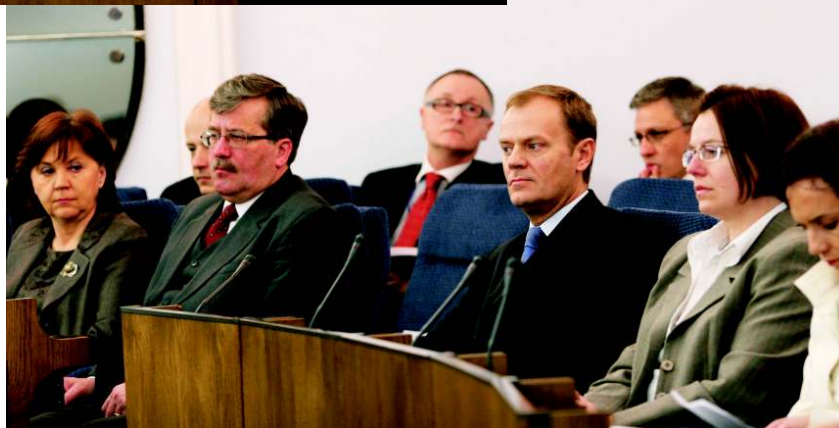
W obradach uczestniczyli marszałek Sejmu Bronisław Komorowski i premier Donald Tusk