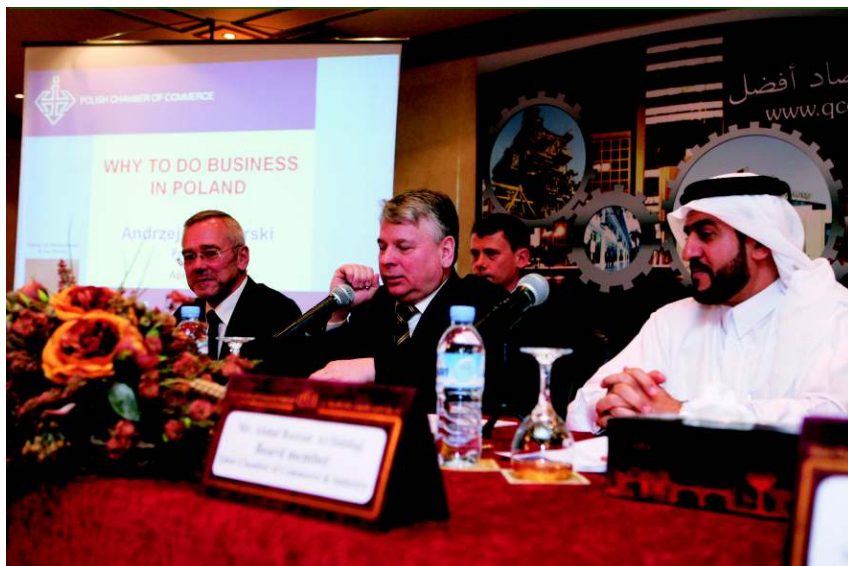
Spotkanie z przedsiębiorcami w Izbie Handlowej Kataru