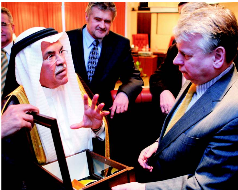
Spotkanie z szejkiem Salehem Bin Humaidem, przewodniczącym Zgromadzenia Doradczego Królestwa Arabii Saudyjskiej

Podczas rozmowy marszałek podkreślił, że Polska docenia stabilizującą rolę, jaką Arabia Saudyjska odgrywa na Bliskim Wschodzie.