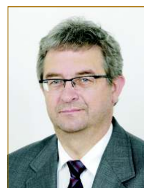
Senator Maciej Klima, przewodniczący Komisji Obrony Narodowej

Należy do Polskiego Związku Łowieckiego. Jest członkiem Prawa i Sprawiedliwości. Żonaty, ma jedno dziecko.