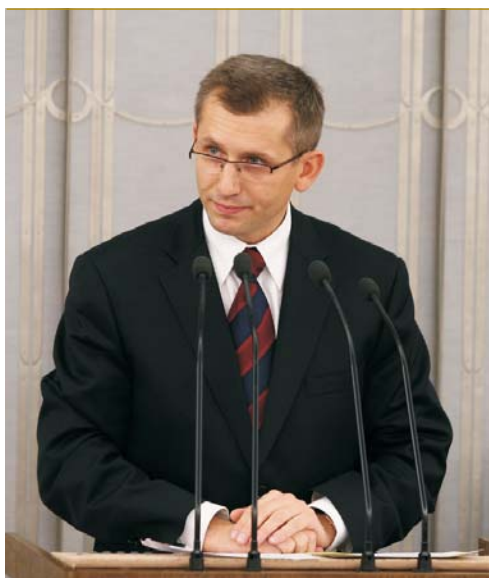
Senator Krzysztof Kwiatkowski w imieniu Komisji Ustawodawczej rekomendował Izbie projekt uchwały o ogłoszeniu roku 2009 Rokiem Polskiej Demokracji.