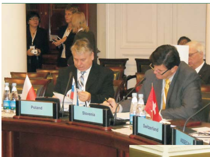
Marszałek Bogdan Borusewicz wzięł udział w nadzwyczajnym spotkaniu Stowarzyszenia Senatów Europy, zwołanym z okazji 15. rocznicy powołania do życia Rady Federacji Zgromadzenia Federalnego Federacji Rosyjskiej.