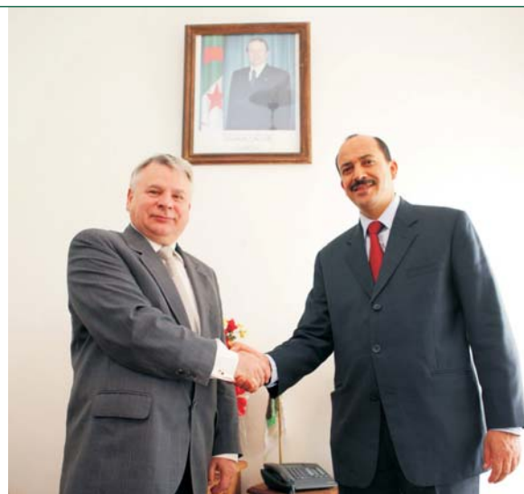
Marszałek Bogdan Borusewicz spotkał się z algierskim ministrem małych i średnich przedsiębiorstw Mustafą Benbadą.

„W mojej ocenie Algieria jest dla nas bardzo ważnym partnerem” – oświadczył marszałek w wypowiedzi dla prasy. Zwrócił też uwagę na nasz bardzo korzystny bilans handlowy z Algierią. Jego zdaniem, to kraj bardzo atrakcyjny pod względem gospodarczym. Podkreślił rów-