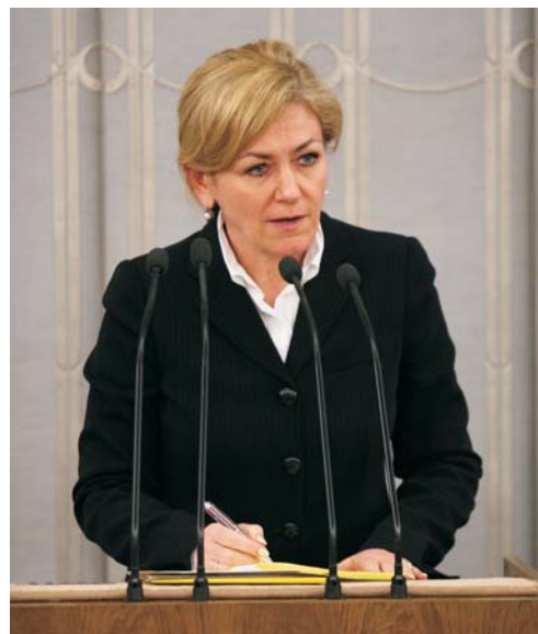
Wicemarszałek Krystyna Bochenek, z upoważnienia Prezydium Senatu, przedstawiła kalendarium obchodów roku 2009 jako Roku Polskiej Demokracji.

tu Polski do rodziny krajów demokratycznych. Ich wynik jednoznacznie dowiódł, że Polacy chcą sami decydować o swoim losie.