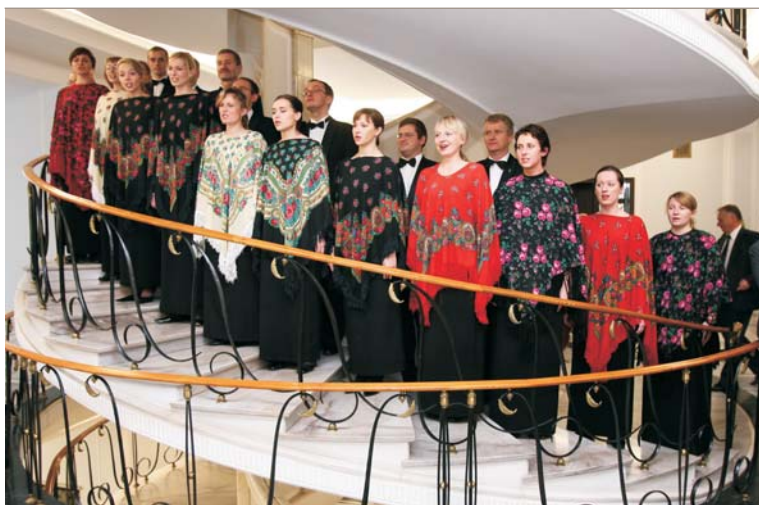
Występ Chóru Akademickiego Politechniki Szczecińskiej uświetnił otwarcie wystawy poświęconej Józefowi Piłsudskiemu.

Ekspozycja obejmuje 48 fotografii i jest fragmentem wystawy zorganizowanej przy finansowym wsparciu Senatu i prezentowanej z okazji 140. rocznicy urodzin Józefa Piłsudskiego w grudniu ubiegłego roku w Domu Kultury Polskiej w Wilnie. Zdjęcia przedstawiają m.in. żmudzki rodowód marszałka, lata nauki w Wilnie, jego działalność polityczną i wojskową, ulubione miejsca wypoczynku na Grodzieńszczyźnie, a także uroczystości pogrzebowe związane z jego śmiercią w 1935 r. Fotografie w wielu wypadkach pokazują marszałka nie tylko jako znanego polityka, ale także od strony prywatnej i rodzinnej. Wśród nich są m.in. zdjęcia Druskienników i Pikieliszek, gdzie marszałek wypoczywał z rodziną. Prezentowane plansze zawierają także fragmenty jego wypowiedzi oraz informacje historyczne. Wśród zamieszczonych tekstów szczególnie podkreślono słowa J. Piłsudskiego, które dotyczą pamięci historycznej: „Kto nie szanuje i nie ceni swojej przeszłości, ten nie jest godzien szacunku terażniejszości ani nie ma prawa do przyszłości” – mówił J. Piłsudski w 1922 r.