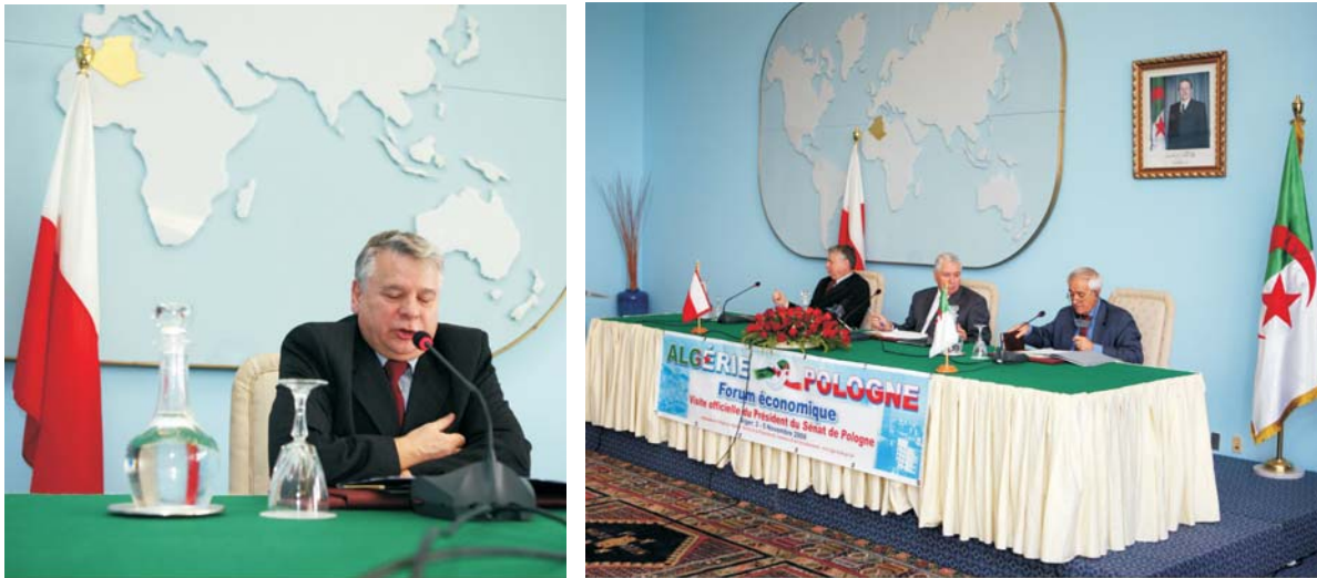
Marszałek Bogdan Borusewicz wziął udział w inauguracji Polsko-Algierskiego Forum Ekonomicznego.

spodarka jest gospodarką niedoboru, co powoduje, że rynek tego kraju jest niezwykle chłonny. Prezydent Algierii stwierdził, że w celu wzmocnienia współpracy gospodarczej między naszymi państwami należy reaktywować Komitet Mieszany ds. Współpracy Gospodarczej i Naukowo-Technicznej, który po raz ostatni spotkał się w 1986 r.