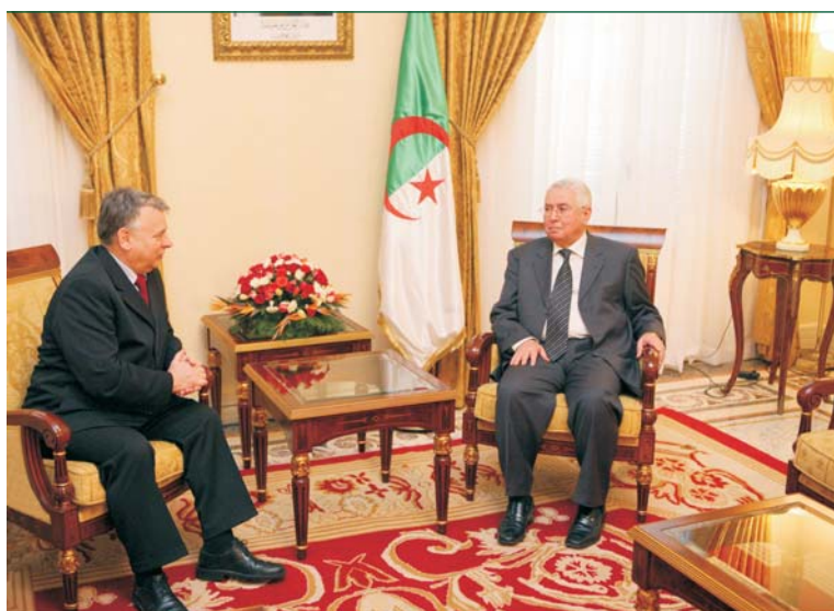
Rozmowy marszałka Bogdana Borusewicza i delegacji Senatu RP w algierskiej Radzie Narodu.