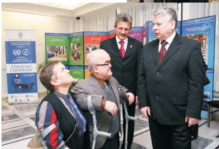
Wystawę „Uwolnić chodniki” otworzył marszałek Bogdan Borusewicz.