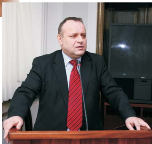
Podczas konferencji „Niepełnosprawni w podróży” pełnomocnik rządu ds. osób niepełnosprawnych senator Jarosław Duda przedstawił politykę państwa wobec osób niepełnosprawnych.