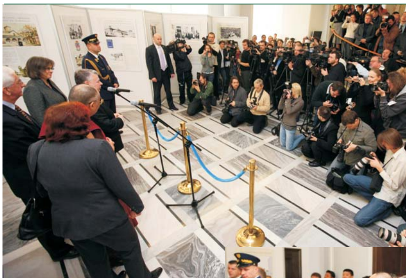
Konferencja prasowa podczas wizyty Dalajlamy XIV w Senacie.