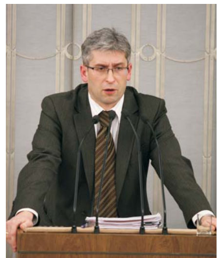
W imieniu rządu przyjęcie ustawy o funduszach dożywotnich emerytur kapitałowych rekomendował Izbie wiceminister pracy i polityki społecznej Marek Bucior.