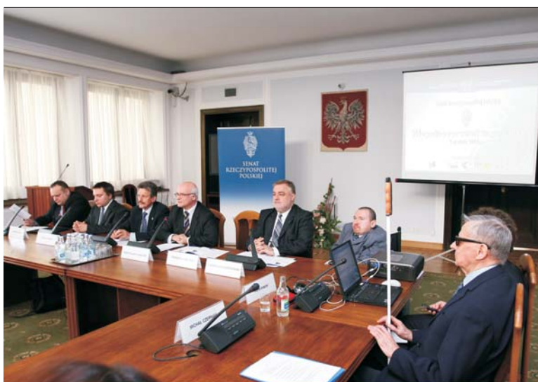
Senackie komisje: rodziny i praw człowieka zorganizowały konferencję „Niepełnosprawni w podróży”.

Otwierając konferencję, przewodniczący Komisji Rodziny i Polityki Społecznej senator Mieczysław Augustyn powiedział, że celem konferencji, organizowanej w przeddzień Światowego Dnia Osób Niepełnosprawnych, jest zwrócenie uwagi na wciąż istniejące w przestrzeni publicznej i społecznej bariery komunikacyjne, utrudniające osobom niepełnosprawnym poruszanie się i podróżowanie. Senator zwrócił uwagę na jej symboliczny tytuł. Polska, jak stwierdził, jest w drodze do równouprawnienia niepełnosprawnych i reszty społeczeństwa, spory odcinek tej drogi został pokonany, nastąpiły zmiany w wielu dziedzinach życia, ale czy już można powiedzieć, że szanse zostały wyrównane? Zdaniem senatora, do osiągnięcia celu