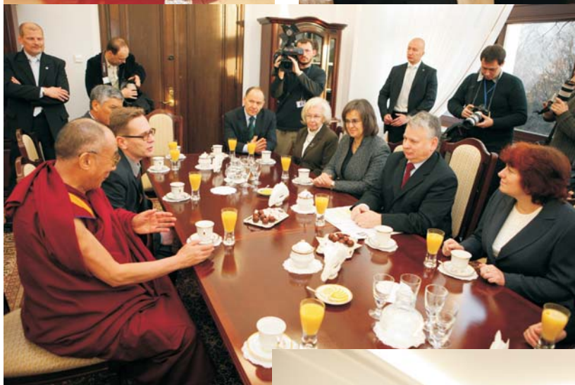
Marszałek Bogdan Borusewicz przyjął, przebywającego w Polsce na jego zaproszenie, duchowego przywódcę Tybetańczyków Dalajlamę XIV.