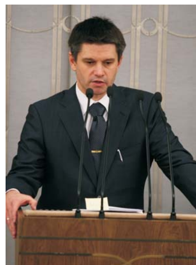
Podczas debaty nad nowelizacją ustawy o podatku akcyzowym na pytania senatorów odpowiadał wiceminister finansów Jacek Kapica.